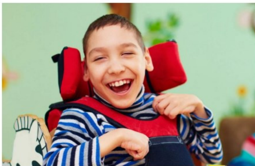
Gyönyörű gyerekek, akik nem ezt a sorsot érdemelnék

Komoly idegrendszeri problémák özönét tárta fel egy új kutatás azoknál a kisgyerekeknél, akiket a szülei védőoltásnak nevezett vakcinázásnak vetettek alá. Az oltott gyermekeknél 212%-kal nagyobb eséllyel jelentkeznek súlyos idegrendszeri megbetegedések, mint az oltatlan társaiknál.