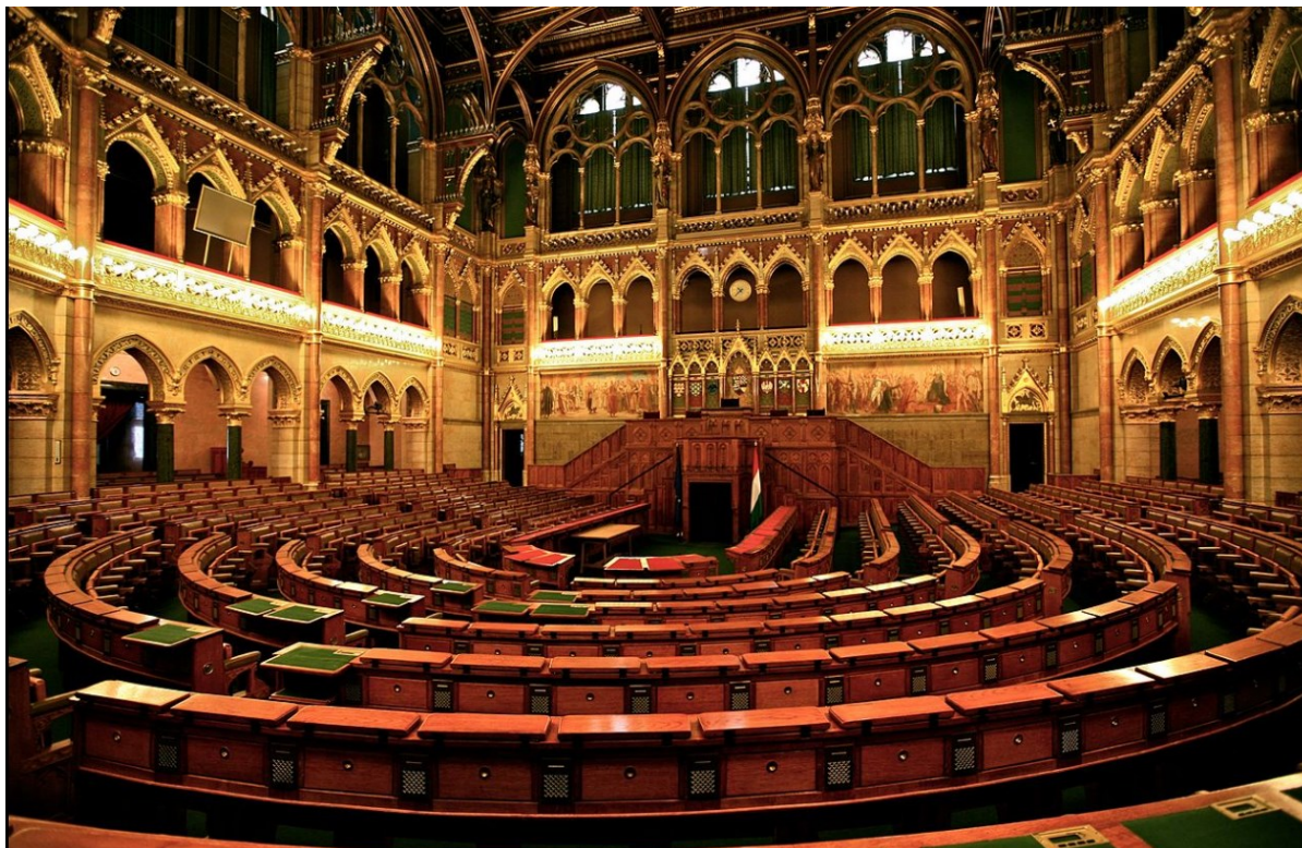
Az Országház felsőházi ülésterme, ma turisták látogatják illetve konferenciák, más rendezvények helyszíne