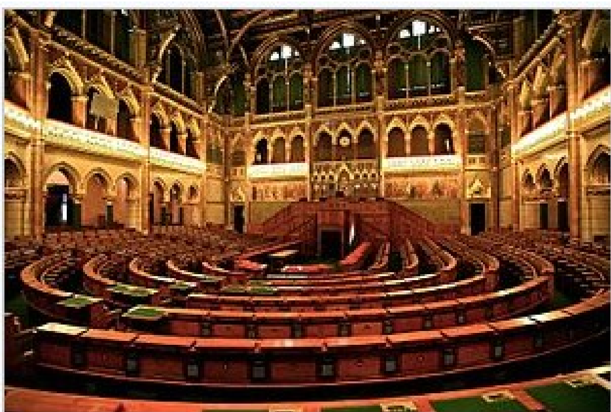
Az Országgház felsőházi ülésterme, ma turisták látogatják illetve konferenciák, más rendezvények helyszíne

1.) 309.Lap 13.pontja: ?????????????????????????????????????????????????????????????